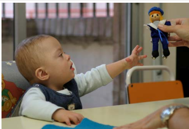
Uno de los niños que acude al programa de Atención Temprana de ANFAS, durante una de las sesiones.

ANFAS ha puesto en marcha en octubre en Pamplona el programa de Atención Temprana, dirigido a niños de 3 a 6 años con alteraciones en el desarrollo o riesgo de padecerlas. Las sesiones son impartidas por una logopeda y una estimuladora y se están desarrollando en el Colegio Misioneras, situado en la calle Aoiz de Pamplona, que ha cedido una de sus aulas para el programa. Actualmente, ANFAS ofrece este servicio a niños de 0 a 6 años en las localidades de Estella, Tudela, Alsasua, Tafalla, Santesteban y Lesaka. En Pamplona, el Centro Base del Gobierno de Navarra es el encargado de impartir el programa a niños de 0 a 3 años. Las familias interesadas pueden contactar con Imelda Buldain, Resp. Servicios de Pamplona. en el teléfono 948 275000.