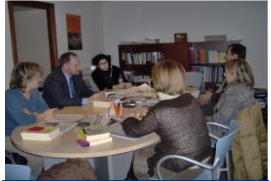
REUNIÓN INFORMATIVA EN FEAPS NAVARRA. FEAPS Navarra convocó a los miembros de sus entidades a una reunión informativa sobre el III Encuentro de Buenas Prácticas.

Una vez recibidas todas las BBPP en las diferentes Federaciones, un Comité de Valoración, compuesto por expertos de FEAPS y de otras organizaciones, elegirán tres Buenas Prácticas excelentes correspondientes a Calidad de vida, Calidad total y Compromiso Ético. Asimismo, se seleccionarán también otras doce BBPP que serán expuestas en el Encuentro de Bilbao.